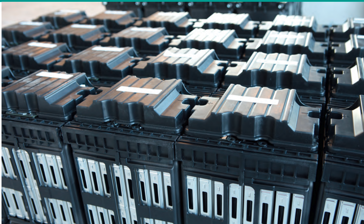
Speichermodule des grössten Schweizer Batteriespeichers in Volketswil.