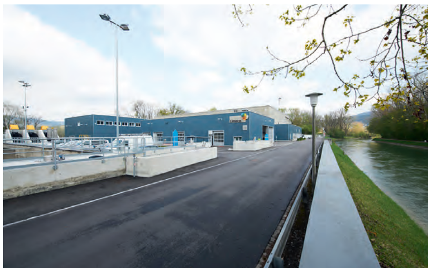
Hier am Standort von Limeco in Dietikon entsteht die weltweit grösste, industrielle Power-to-Gas-Anlage mit biologischer Methanisierung.

kann. Mittelfristig wird es für die saisonale Speicherung auch in der Schweiz Gasspeicher brauchen. Gegenüber Wasserspeichern haben diese einen zentralen Vorteil: Um die gleiche Menge an Energie zu speichern, ist 100-mal weniger Volumen nötig.